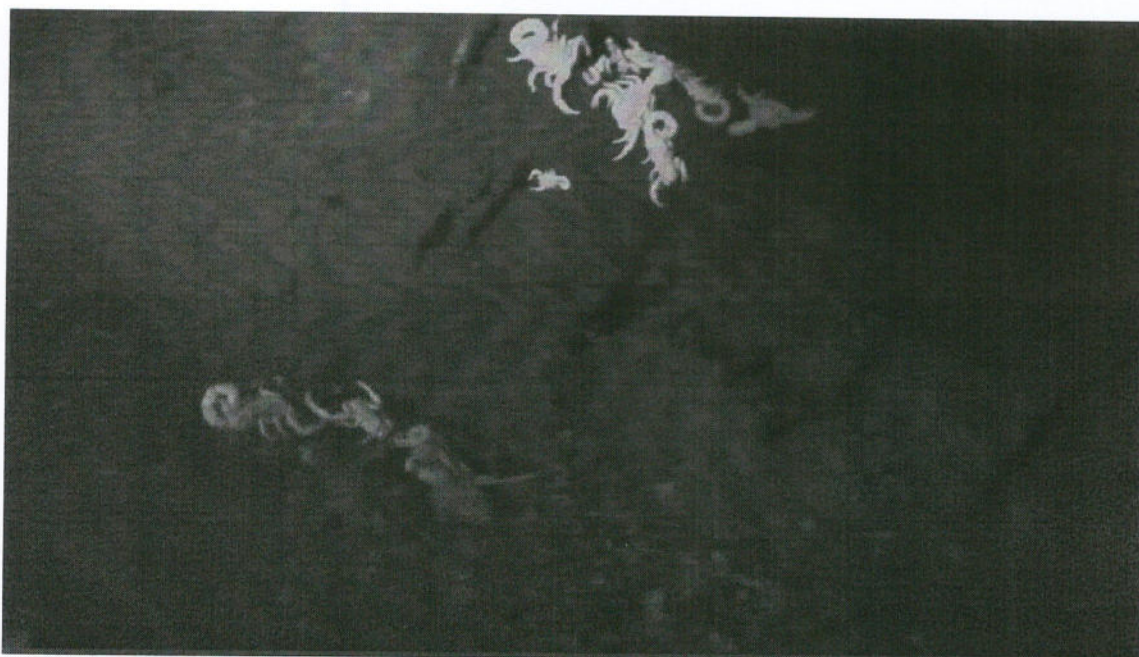
FOTO UTILIZANDO LUZ NEGRA