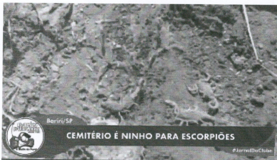
REPORTAGEM BARIRI RADIO CLUBE – 24/02/2021